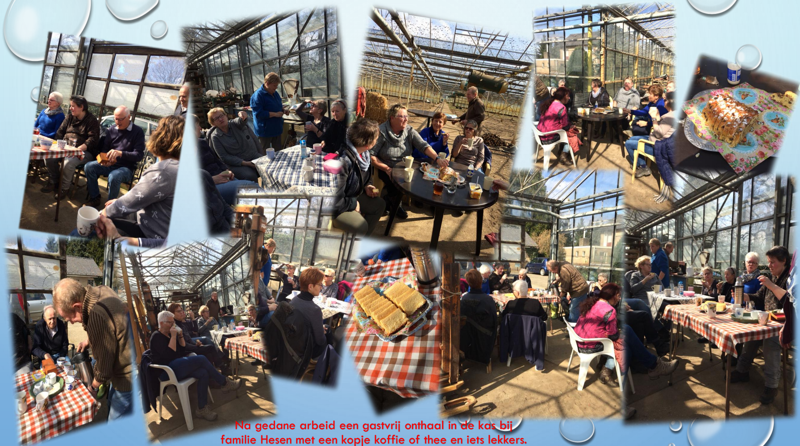
Na gedane arbeid een gastvrij onthaal in de kas bij familie Hesen met een kopje koffie of thee en iets lekkers.