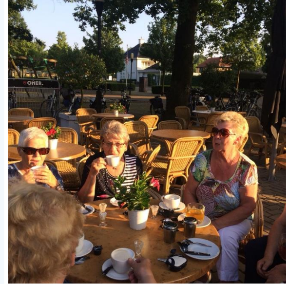
Het was een mooie route