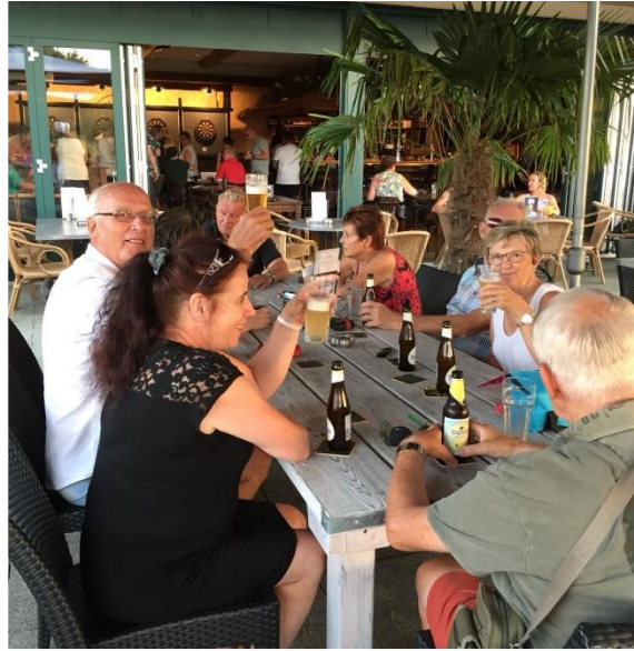
De pauze was dit keer bij restaurant 't Vertier te Afferden.