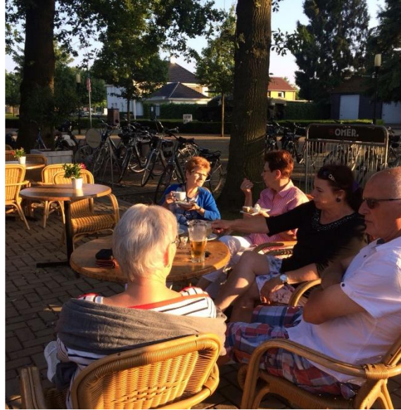
Pauze in Overloon