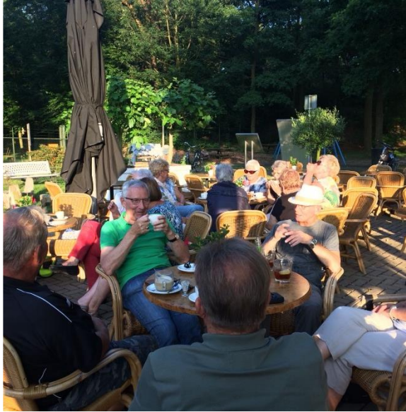
Route uitgezet door: Nellie de Kok