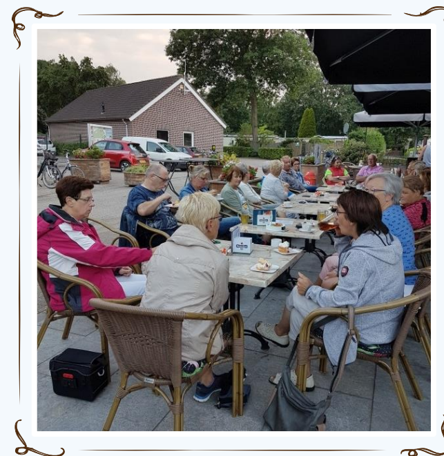
Het was weer een mooie route door "Oud" Bergen naar Heijen en via de golfclub weer terug.