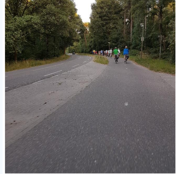
Na een mooie en leuke tocht door Afferden richting Ottersum. Na de pauze weer via Afferden richting huis.