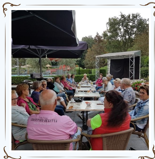
Genieten van de pauze bij "De Gasterij" in Heijen.