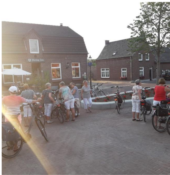
Route uitgezet door: Corrie Litjens