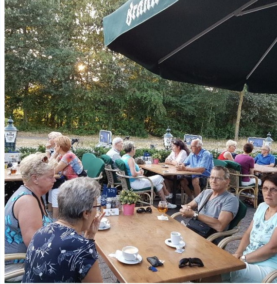
Na een kilometer of 18 fietsen een welverdiende pauze bij "Old Inn" in Ottersum.