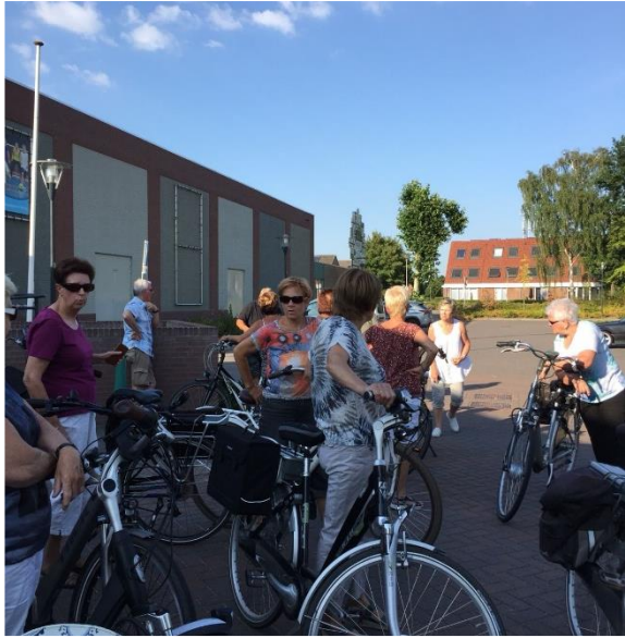
Route uitgezet door: Mientje Peeters