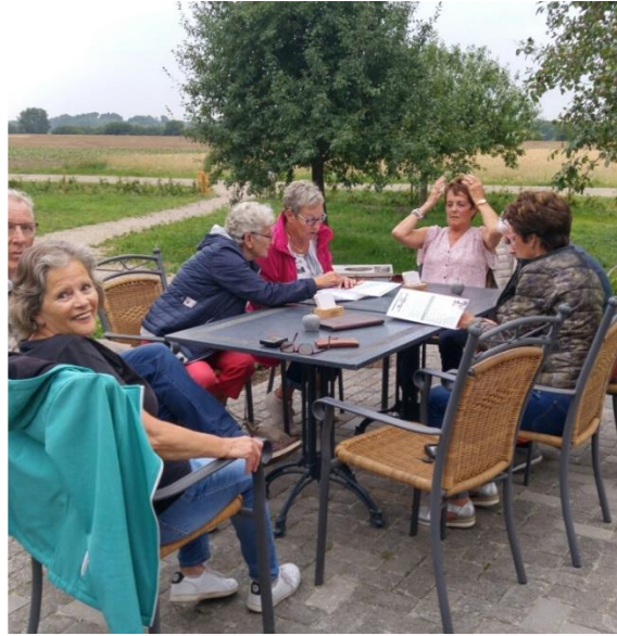
Rustplaats na 27 km fietsen bij IJs en koffie hof D'n Boggerd in Aijen..