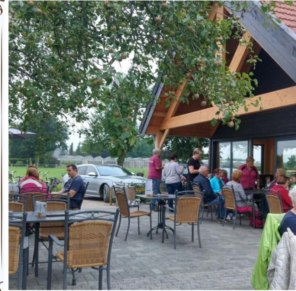
Rondje via de schaapskooi, Wezerweg, door de bossen naar Wellerlooi en langs de Maas terug. Totale lengte 30 km