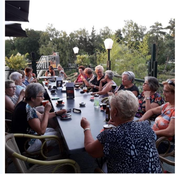
Het was een mooie tocht eerst richting Siebengewald en door naar Duitsland dan richting Afferden en via de golfbaan weer richting Bergen