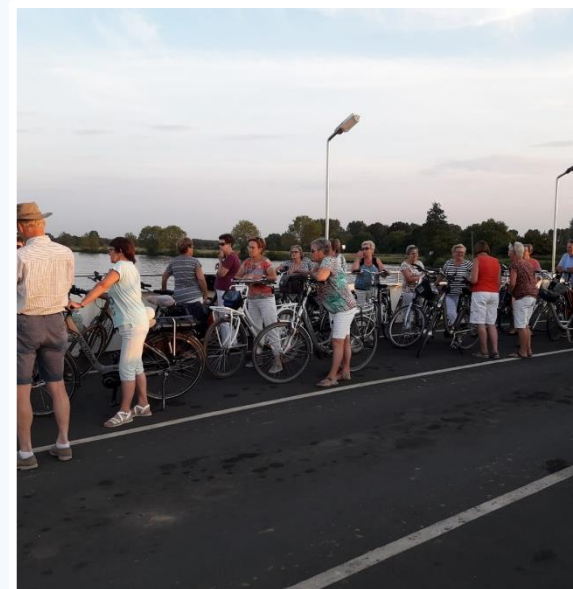
Met 26 personen een mooie route gereden via Blitterswijck en Geysteren en met de pont weer terug.