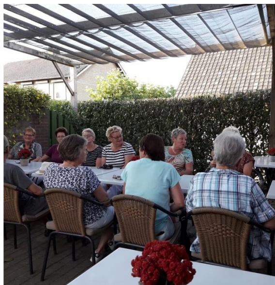
Toe aan een verfrissing. De pauze werd gehouden in Geysteren.